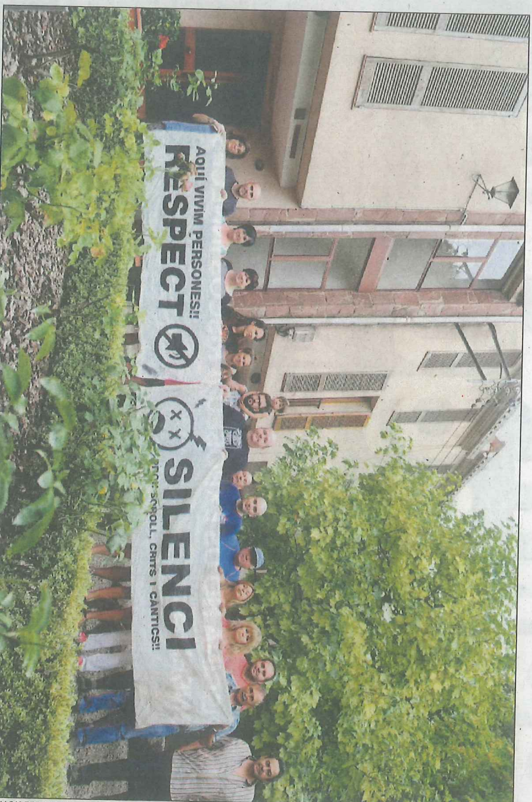
Grup de veïns del Mas Badó reclamen tranquil·litat i silenci

Una altra queixa dels veïns és el soroll del motor d'una màquina tallagespa que es fa servir com a tractor per treballar objectes, així com un bufador que aixeca una gran quantitat de pols. Martínez