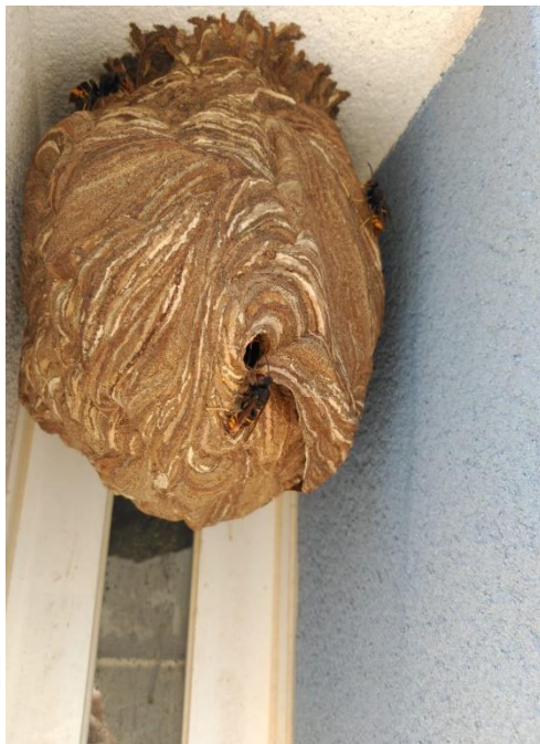
Il·lustració 1. Niu de vespa velutina.